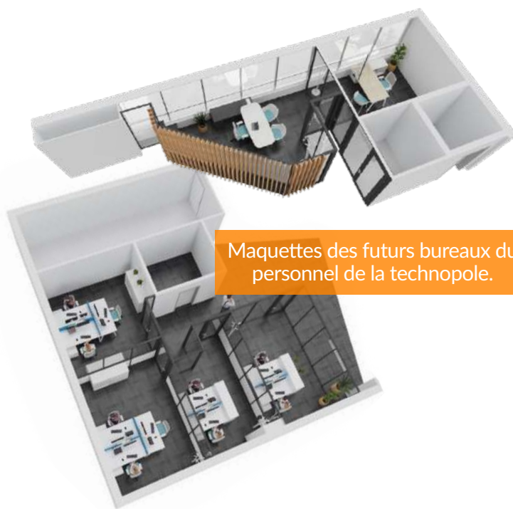
Maquettes des futurs bureaux du personnel de la technopole.