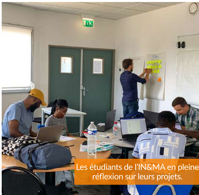
Les étudiants de l'IN&MA en pleine réflexion sur leurs projets.