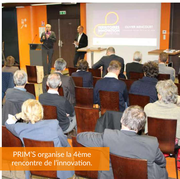
PRIM'S organise la 4ème rencontre de l'innovation.

PRIM'S (Pôle de Recherche et d'Innovation du Mans et de la Sarthe) est une association créée en 1984, dont la mission est de rapprocher le monde de l'entreprise et de l'enseignement supérieur en favorisant les collaborations et l'innovation. En sommeil depuis 2017, Le Mans Innovation propose une série d'actions pour relancer le pôle.