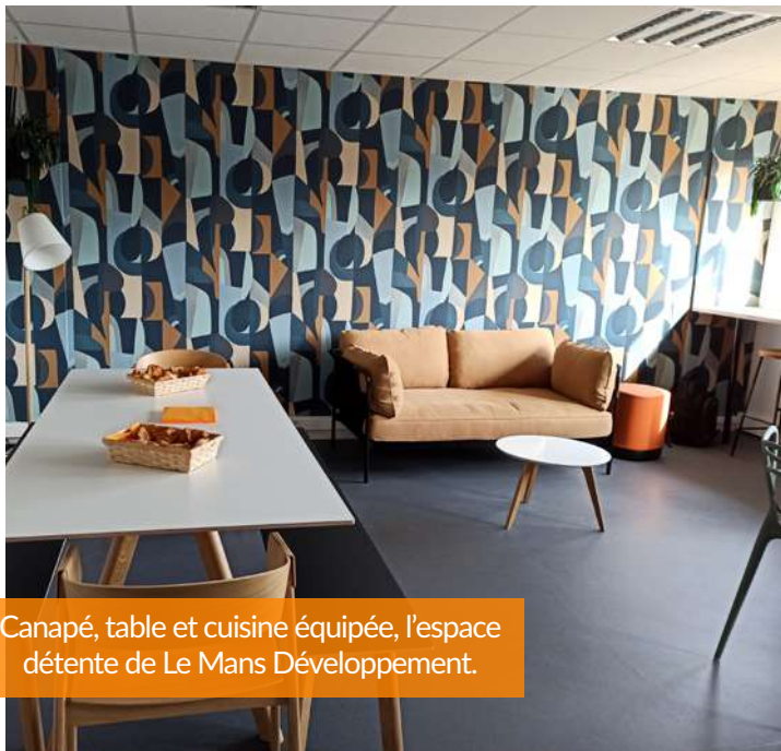
Canapé, table et cuisine équipée, l'espace détente de Le Mans Développement.

Le 24 mai, le SMAT inaugurerait le nouvel espace de restauration de sa pépinière d'entreprises Novaxis, située au 75 boulevard Marie et Alexandre Oyon, au Mans.