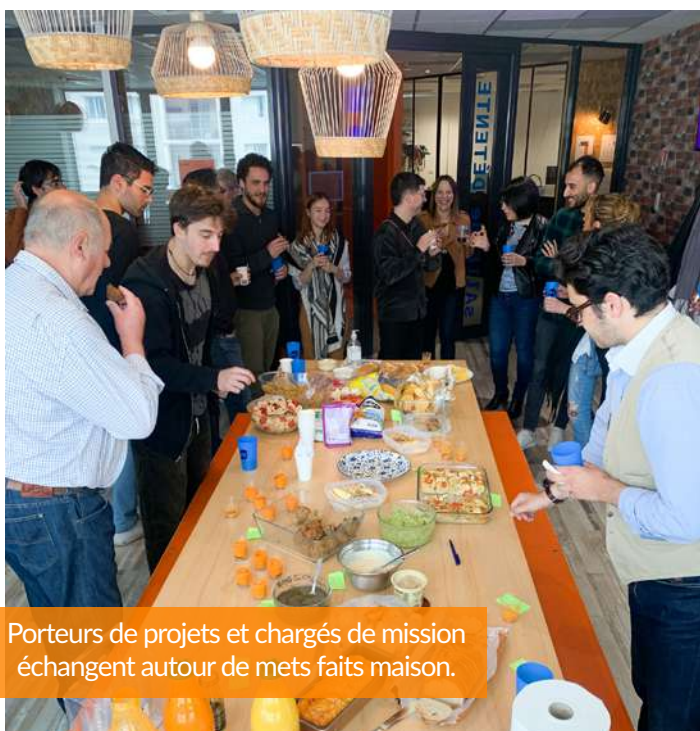
Porteurs de projets et chargés de mission échangent autour de mets faits maison.

Tous les deux mois environ, Le Mans Innovation organise un repas partagé entre porteurs de projets accompagnés. Le dernier Café Papote du mois de Mai portait sur les « saveurs du Monde ».