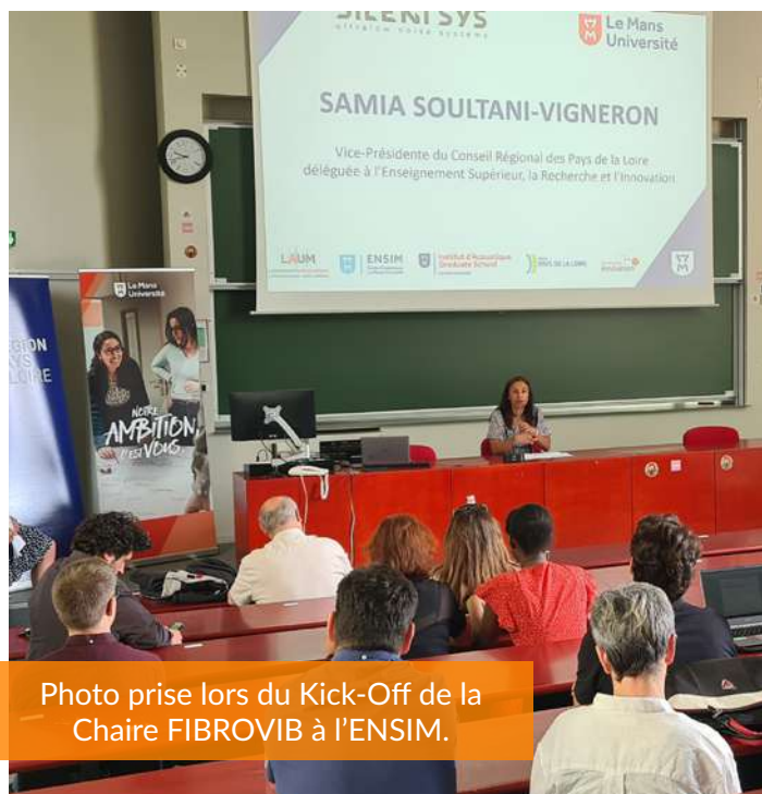
Photo prise lors du Kick-Off de la Chaire FIBROVIB à l'ENSIM.

Le 30 mai, Silentsys, Le Mans Université, l'ENSIM (Ecole d'ingénieurs Le Mans Université) et le LAUM (Laboratoire d'Acoustique de l'Université du Mans) inauguraient le lancement de leur Chaire à l'ENSIM.