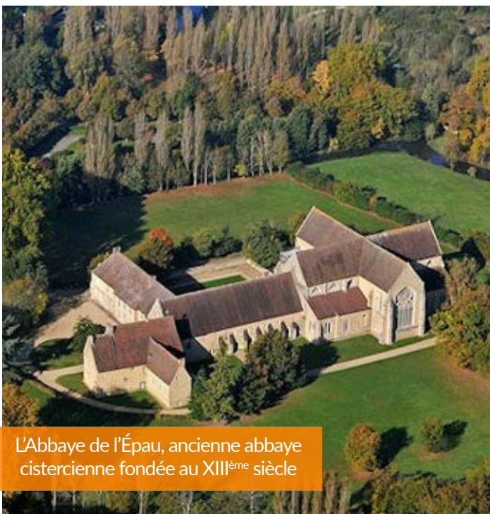
L'Abbaye de l'Épau, ancienne abbaye cistercienne fondée au XIII ème siècle

Dans le cadre du projet « Quand l'innovation rencontre le patrimoine », mené par l'entreprise Soma et l'Université du Mans, 10 étudiants en Master II Patrimoine se sont rendus à l'Abbaye de l'Épau afin de mettre en lumière l'illustre bâtisse par la création de 3 designs sonores.